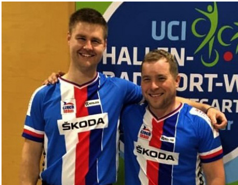
TJ Favorit Brno