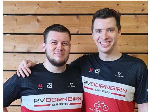
RV Dornbirn 2