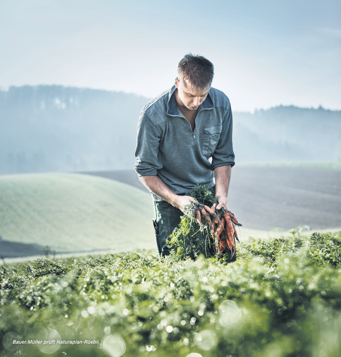
Bauer Müller prüft Naturaplan-Rüebli