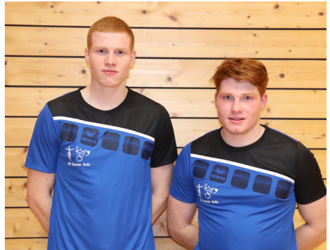
RV Enzian Sulz