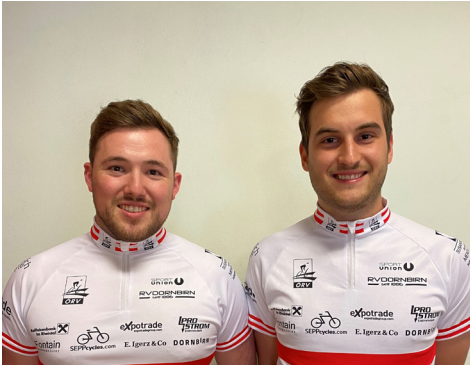
RV Dornbirn 1